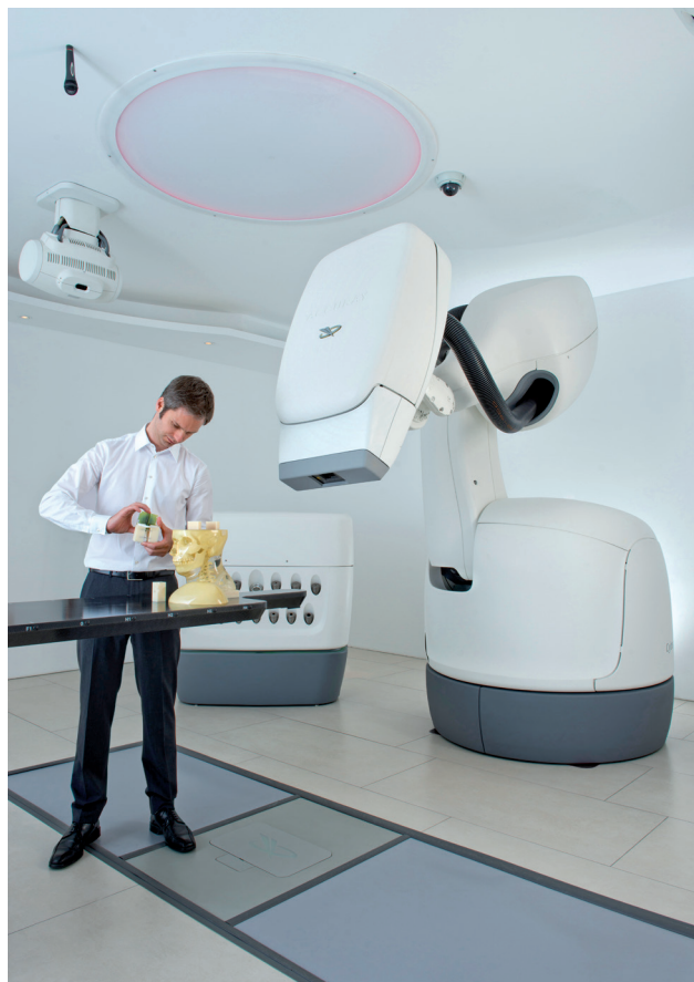
Abb. 2: Medizinphysiker prüft Präzision und Sicherheit.

wissenschaftlich analysiert. Mit der Neurochirurgischen Klinik unterhält es eine Zusammenarbeit bei Indikationen im Bereich des Kopfes und spinalen Tumorentitäten. Mit der Urologischen Klinik gibt es einen intensiven klinischen und wissenschaftlichen Austausch zu komplexen Tumorfällen. Die Cyberknife-Therapie insbesondere von Karzinomen der Nieren wird damit gemeinsam begutachtet. Eine enge Zusammenarbeit gibt es außerdem mit der Klinik für Augenheilkunde. Hier liegt die Expertise im Bereich des malignen uvealen Melanoms. Das Zentrum hat sich gemeinsam mit den Ophthalmologen der Klinik auf die Behandlung von Aderhautmelanomen spezialisiert und nimmt hier eine weltweit führende Rolle bei der radiochirurgischen Behandlung am Auge ein.